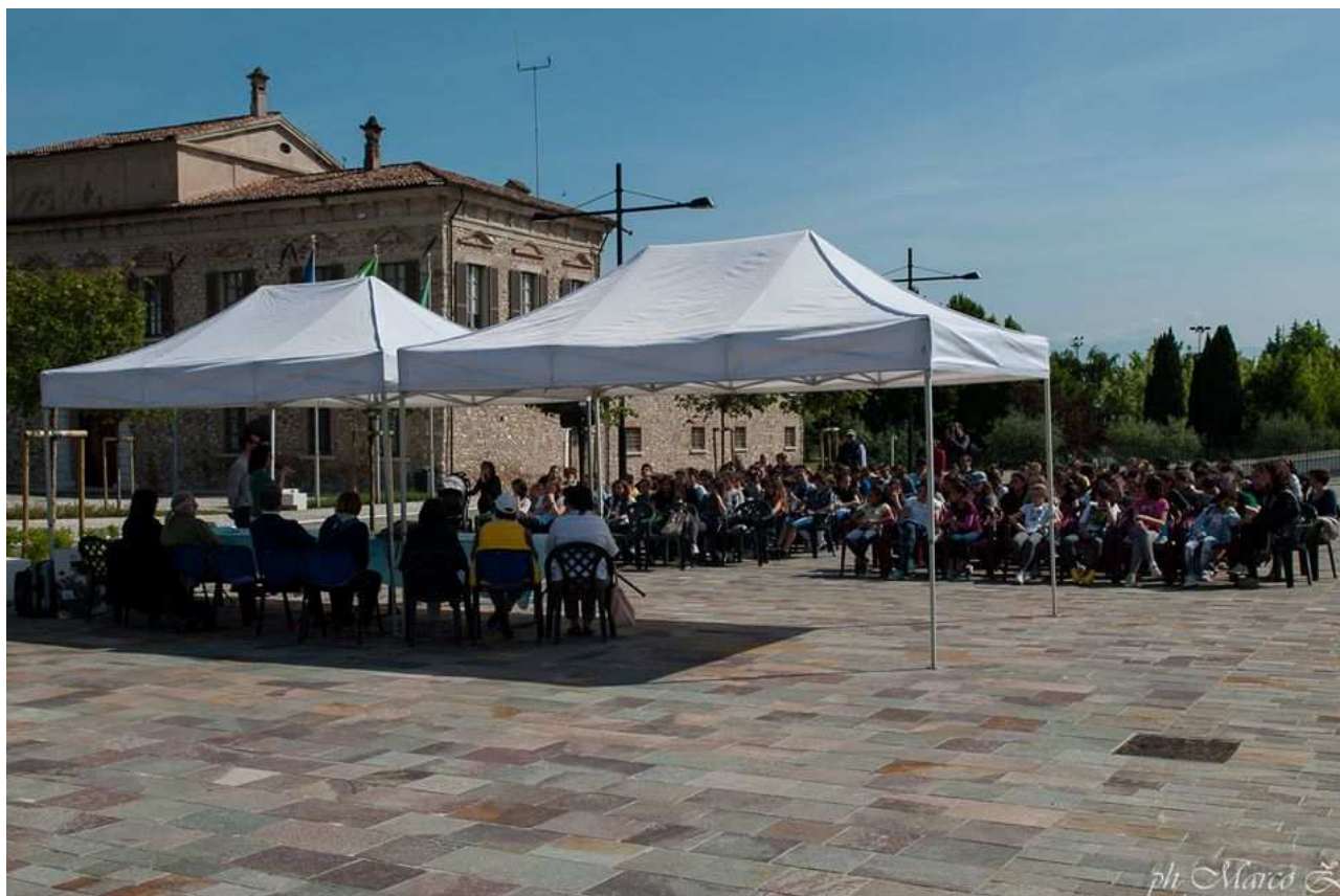
PADENGHE SUL GARDA - 21 MAGGIO 2016. Premiazione della 28 a Edizione del Premio Valtenesi Narrativa per ragazzi